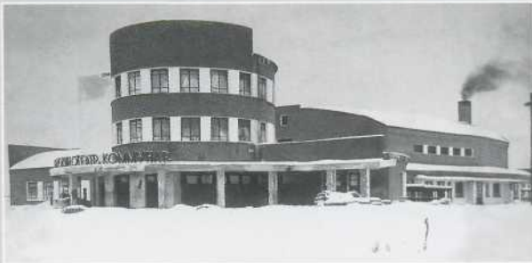
▲ Фото 1930-х гг.