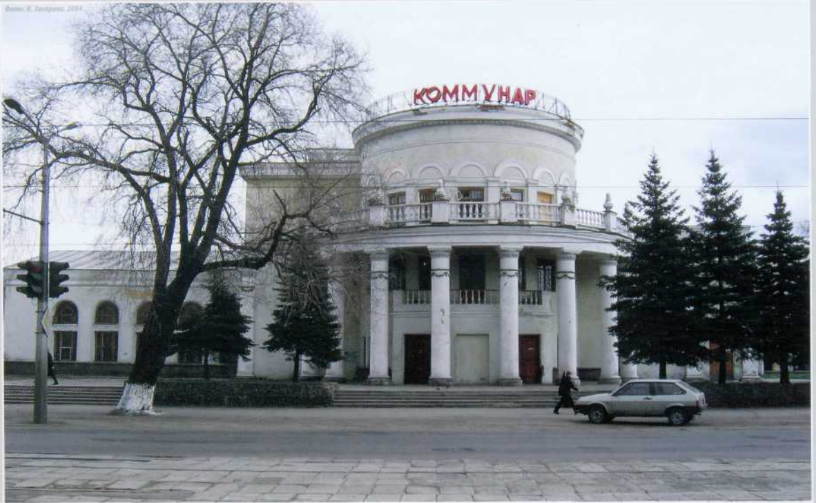
▲ Г. Козель. Кинотеатр «Коммунар», 1933